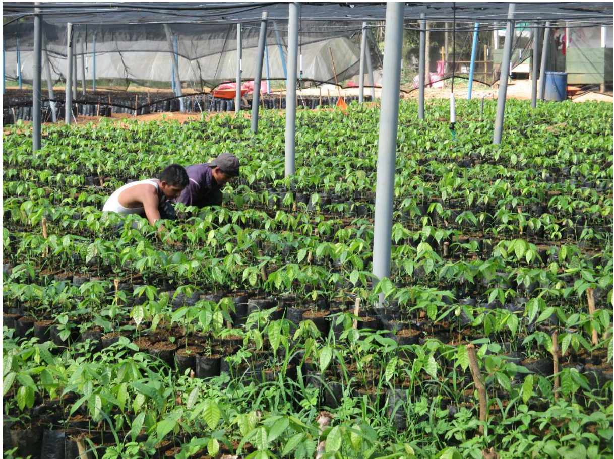
Nouvelle pépinière de cacao

FADCANIC possède de nombreuses parcelles et vend principalement des semences et des plantes. Car l'objectif de FADCANIC est d'offrir une réserve génétique de graines pour les paysans, et non de vendre les matières premières, c'est pourquoi FADCANIC produit aussi du chocolat et du cacao en poudre, afin de donner de la valeur ajoutée au produit.