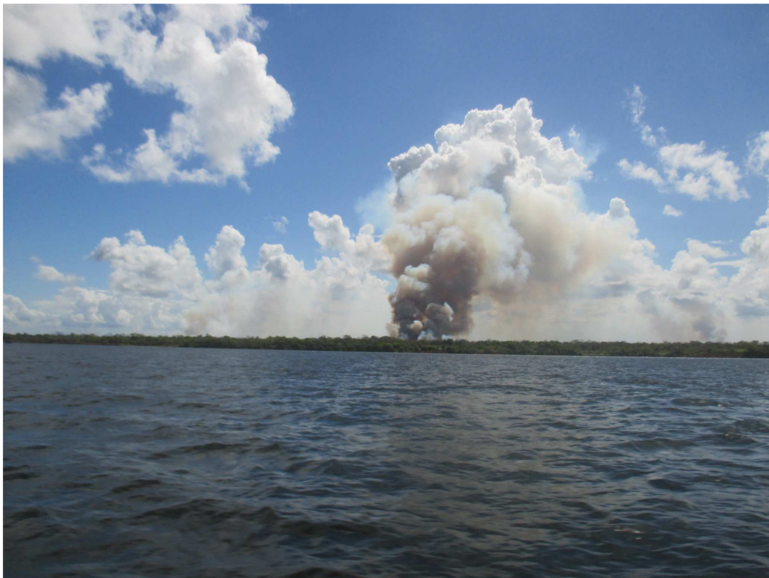
Incendie de forêt a Wawashang

Le mois prochain, FADCANIC va rassembler tous les acteurs de la région, ( Ministère de l'environnement, les gouvernement indigènes, les paysans de la region,...) afin de trouver des solution à la déforestation, et contrôler la destruction de l'aire protégée de Wawashang, qui ne l'est que sur le papier.