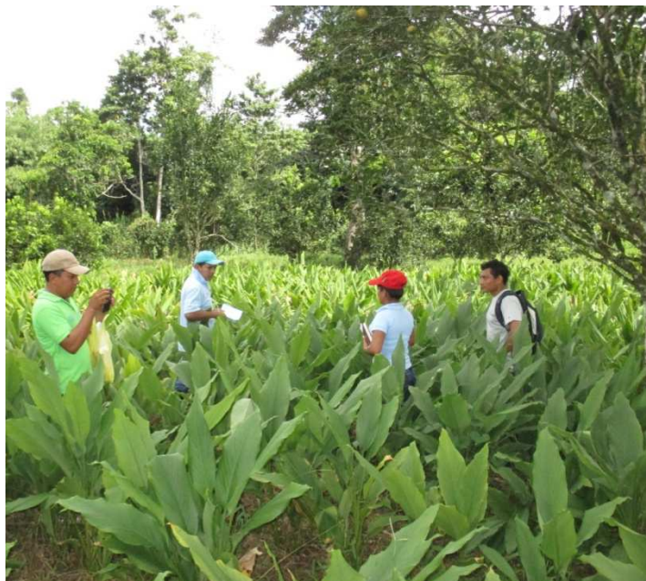
Travail dans les champs a Wawashang

Le centre agro forestier possède des infrastructures pour la production agricole, qui seront mieux intégrée à l'école technique. Ceci permet d'ouvrir une école, avec peu d'investissement, car le principal coût est la construction des ateliers. C'est pourquoi il n'est actuellement pas possible d'offrir la formation en mécanique agricole et marine.